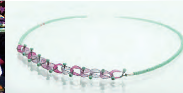
collar Viena, de Stefanie Koelbel. Acero inoxidable, poliamida, cuentas de vidrio, plata. Encaje de bolillos y tintes.

TextilArte se convierta en un gran festival donde se ofrezcan todos los aspectos y todos los niveles de la creación textil: del diseño al arte pasando por la artesanía tradicional y contemporánea, la moda y la restauración.